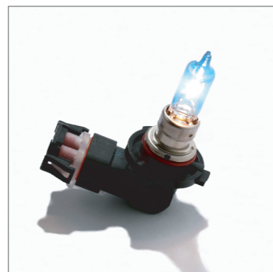
パウダースノー ON 状態のハロゲンバルブ