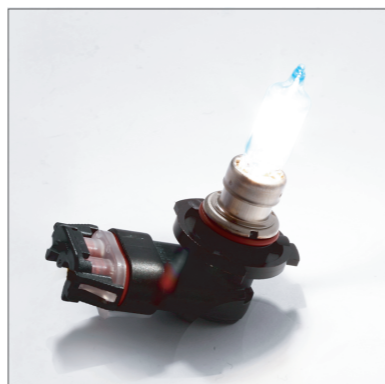
ハイビーム ON 状態のハロゲンバルブ

※当キットにはハロゲンランプは付属しておりません。5000K 程度のハロゲンランプをご用意いただくととても綺麗な青白いパウダースノーカラーを理想的な発色に近づきます。