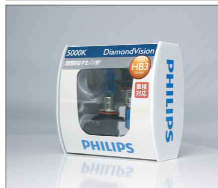
PHILIPS 製 5000K ダイヤモンドビジョン